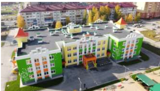
Детский сад № 185, ул. Энергостроителей, 6, корпус 3

В 2020 году также выполнено строительство детского сада на 300 мест в микрорайоне «Войновка» на ул. Энергостроителей, 6, корпус 3, и разработана проектная документация на строительство детского сада в границах улиц Республики-Пермякова-50 лет ВЛКСМ - Воровского (в районе КСК) города Тюмени.