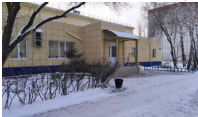
Городская поликлиника № 6, ул. А.Пушкина, 8, Антипино

Жители, проживающие в Антипино, обращались ко мне с просьбой расширить сеть медицинских учреждений в данном районе и провести капитальный ремонт помещения поликлиники № 6 по адресу: ул. Александра Пушкина, 8/1.