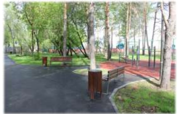
Сквер Александра Моисеенко

Всего в Тюменской области с 2017 года по 2020 год благоустроено 445 объектов, из них 312 дворовых территорий и 133 общественных пространства, израсходовано свыше 6 миллиардов рублей, из них около 400 миллионов рублей из федерального бюджета, около 3 миллиардов рублей из областного бюджета, 2 миллиардов 600 миллионов рублей из местного бюджета.