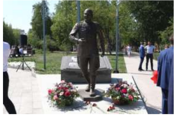
Сквер Якова Неумоева

С 2019 года Тюменской области ежегодно выделяются средства федерального бюджета на реализацию проекта.