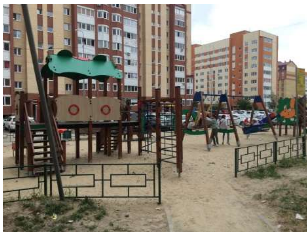
Детская площадка на ул. Домостроителей, 34

По наказу избирателей в 2019 году по моему ходатайству обустроена детская площадка в районе дома № 34 на ул. Домостроителей за счет средств, выделенных из областного бюджета в размере около 1 миллиона рублей.