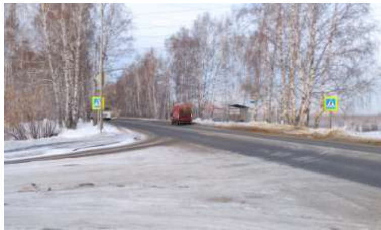
Остановочный пункт на ул. Старый Тобольский тракт, 3-й км в районе поворота на ООО "Хлебокомбинат "Абсолют».

Работники хлебокомбината «Абсолют» обратились с просьбой оказать содействие в обустройстве остановочного пункта на ул. Старый Тобольский тракт, 3-й км в районе поворота на ООО "Хлебокомбинат "Абсолют». В 2020 году в капитальном исполнении обустроен остановочный пункт «Поворот на конно-спортивную базу» (поворот на «Хлебокомбинат Абсолют») и пешеходный переход по ул. Старый Тобольский тракт по направлению движения в город.