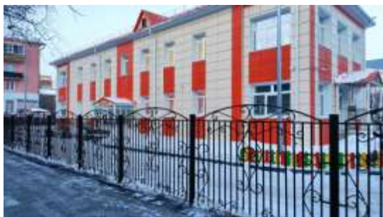
Детский сад № 58, ул. Пржевальского, 52

- выполнены работы по комплексному капитальному ремонту школы № 5 на ул. Холодильная, 73а; выполнено строительство отдельно стоящего корпуса спортивного зала с устройством спортивных площадок на территории школы, а также осуществлена комплектация спортивного зала необходимым движимым имуществом;