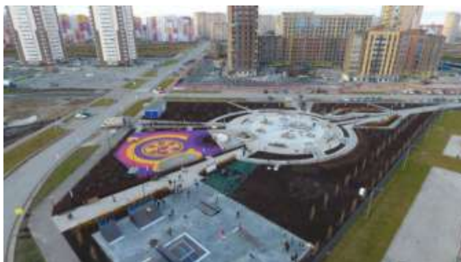
Озелененная территория по ул. Вьюжная, г. Тюмень

В 2020 году «Проект создания комфортной городской среды на территории Центрального парка с прилегающими улицами Шоссейная и Парковая в городе Заводоуковск Тюменской области» признан победителем Всероссийского конкурса. Реализация данного проекта предусмотрена в 2021-2022 годах.