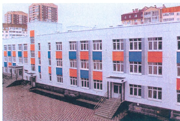
Новое здание школы № 67 в жилом районе «Тура»

Благодаря совместным усилиям органов государственной власти Тюменской области и местного самоуправления в 2023 году введено в эксплуатацию новое здание школы № 67 на ул. Западносибирская, 24 на 1501 учебное место.