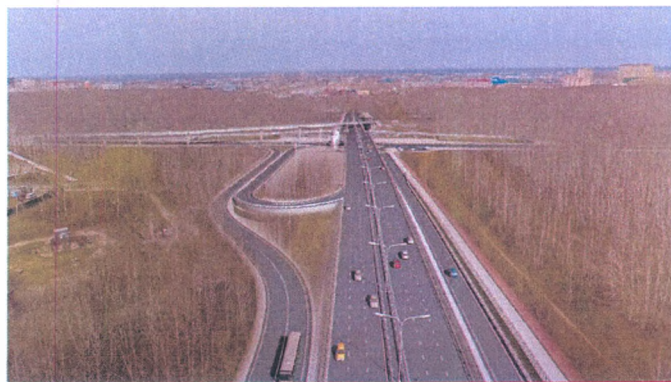
Транспортная развязка на ул. Мельникайте и ул. Дружбы

4. Ремонт проезда от ул. Республики до ул. Республики д. 278а.