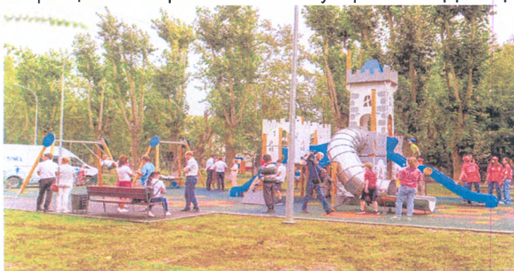
Двор на ул. Мельникайте, 97, ул. Рижская, 43 после благоустройства

Среди обращений граждан по вопросам коммунального хозяйства преобладают обращения с просьбой благоустроить территорию округа.